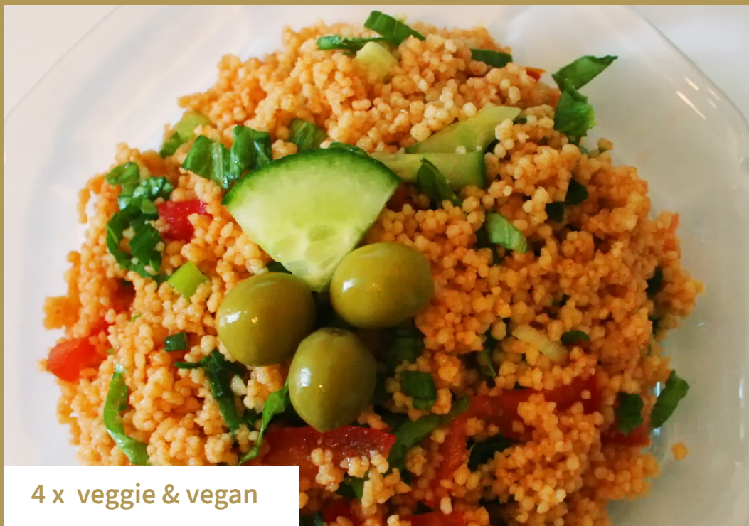
4 x veggie & vegan

Ozbeki Pilav is een gerecht voor groenteliefhebbers. Dit recept gebruikt alle prachtige seizoensgroenten in deze “showstopper”.